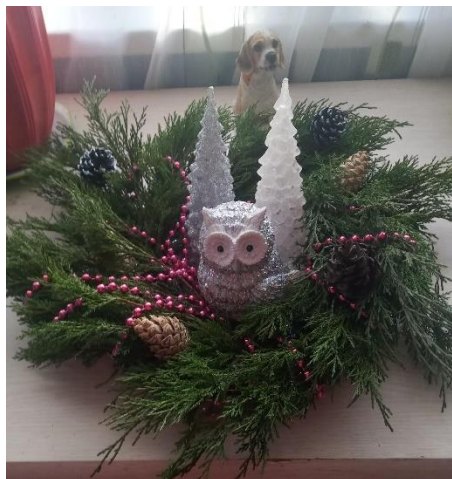
Gerardas Adamkevičius, 6 kl.