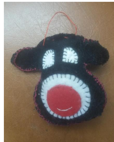
Eglė Petraitytė, 7 kl.