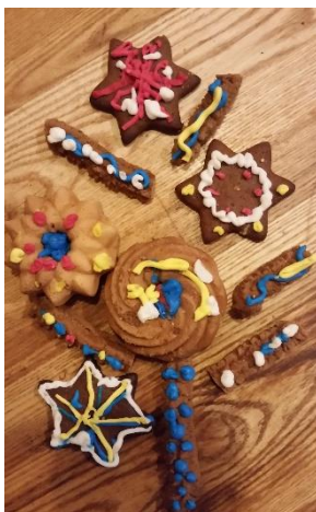
Kepinių dekoras – Simuko Kavaliausko